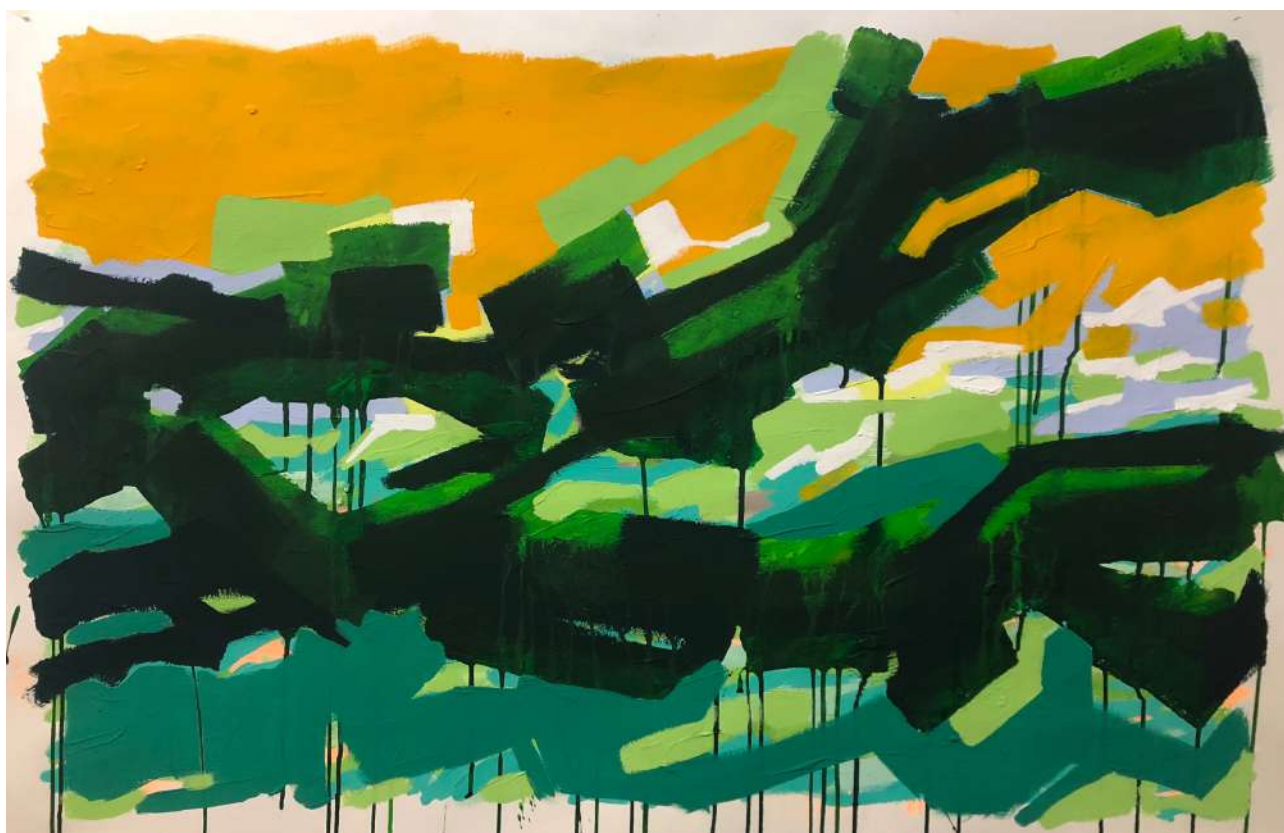
TRAVERSEE 2023 / 75x110 cm / Berny Sauner