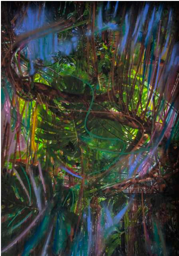
Série « Hommage à Sam » / 63x85 cm