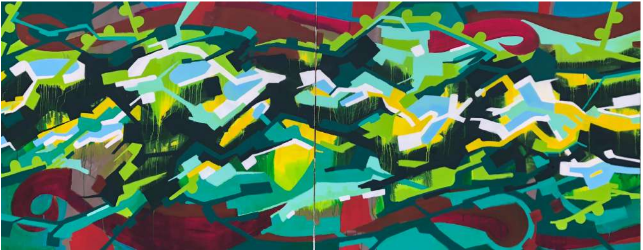
Eté 2023 / 120x300 cm