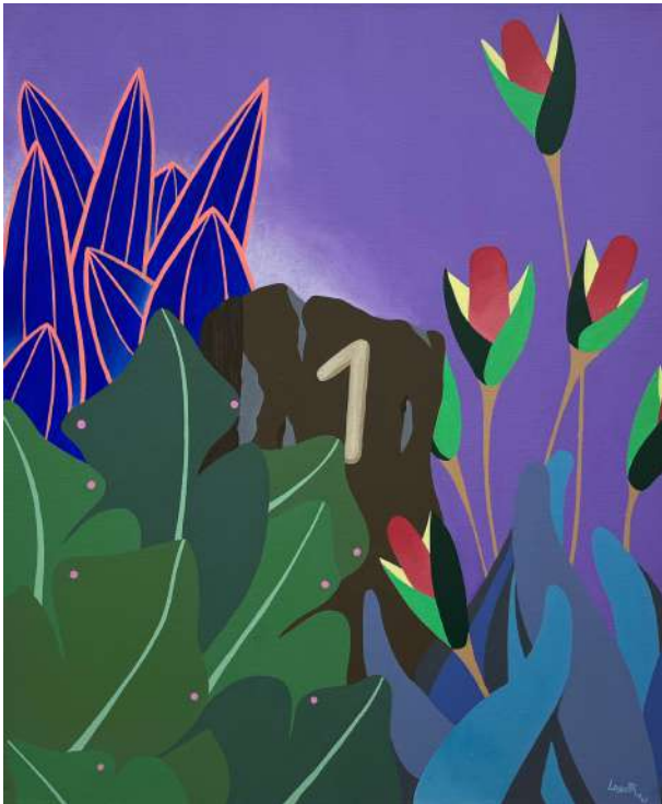
..... N°1 / 2023 / 65x54 cm