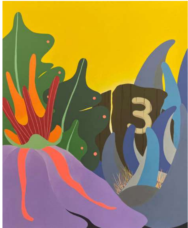
N°3 / 2023 / 81x65 cm