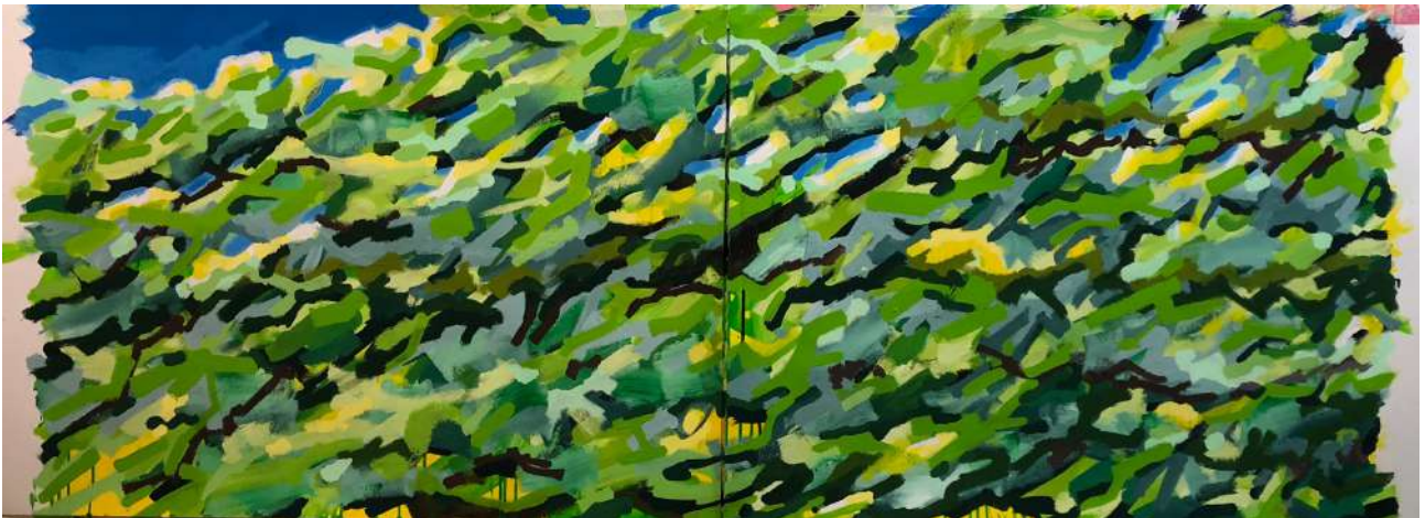
Printemps 2023 / 75x210 cm